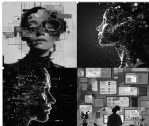
图1 数字化设计示意图

制造集成, 以及更加注重用户体验和可持续性设计。通过这些技术, 设计师和工程师可以更快地开发出更高质量、更经济、更环保的产品, 如图1所示。